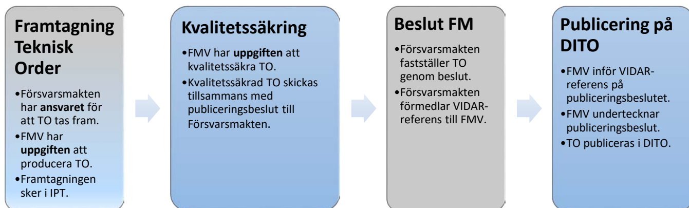
Figur 1 Aktivitetssteg för utarbetande och fastställande av TO

Aktivitetsstegen beskrivs i detalj under 3.2.